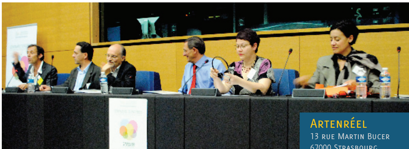
Pannel 1 : La politique de l'emploi : quelles spécificités nationales et régionales ?

“ La créativité est un fondement de l'innovation sociale. ” F. Kern